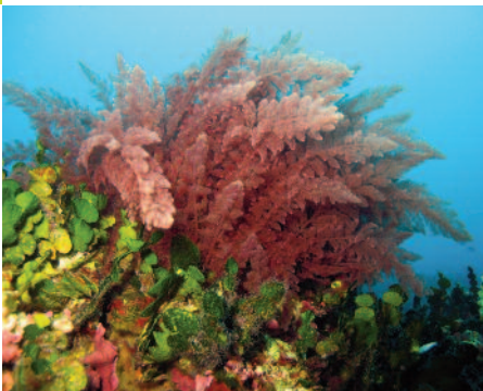
Asparagopsis taxiformis sur les côtes des Pyrénées orientales.